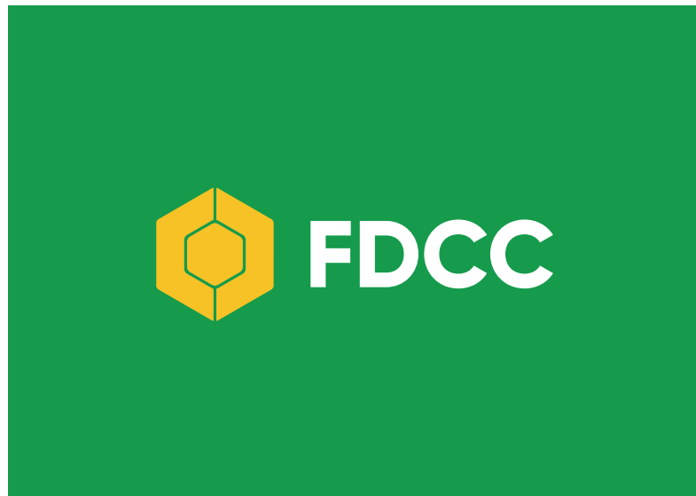
Resumida Fundo verde