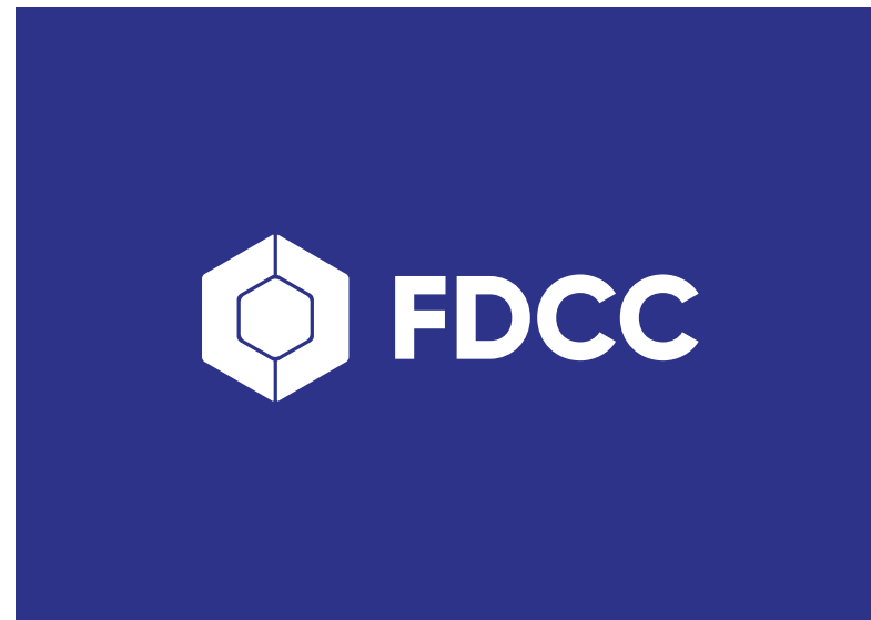
Monocromática Resumida Fundo azul